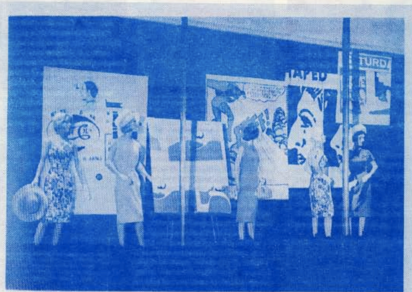
1 Advertisement, 1960

Schaufenstereinrichtungen immer mit seinem eigenen Namen unterschrieben. Konstruierte Momente, wie double feature, welche für einen Augenblick etwas zusammen führen, früher vielleicht aus ökonomischen Gründen (zwei Filme für den gleichen Preis; Hollywood 1930/1049) heute als Verdopplung der Konstruktion, als stilistisches Mittel, Pointen kreieren um diese vielleicht gleich wieder zu verwerfen oder eben zu analysieren.