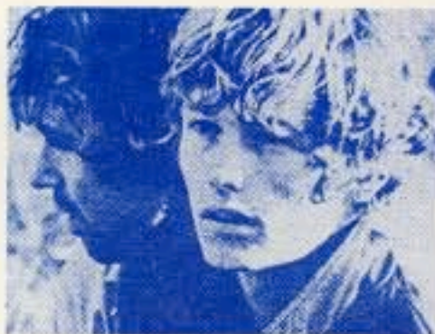
Directed by Andy Warhol — Written by Paul Morrissey — Starring Julian Barringer and Joe Dolenc — USA 1969 — English — 101min

Pretty Ambitious III Montag, 27.4.2009, 19 Uhr