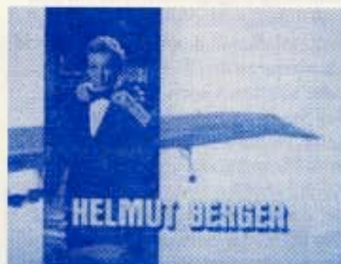
Executive producer Aaron Spelling — Created by Richard & Esther Shapiro — Starring n.a. Helmut Berger — USA 1982 — English — 35min

"I'm in the oil business and you of all people should know it's not a nine to five operation." — Quote from Dynasty