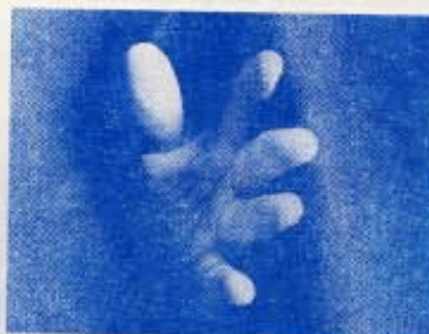
Directed by Robert Bresson — Starring Martin La Salle and Marika Green — France 1959 — English — 75min

— L'introduction du film, Robert Bresson